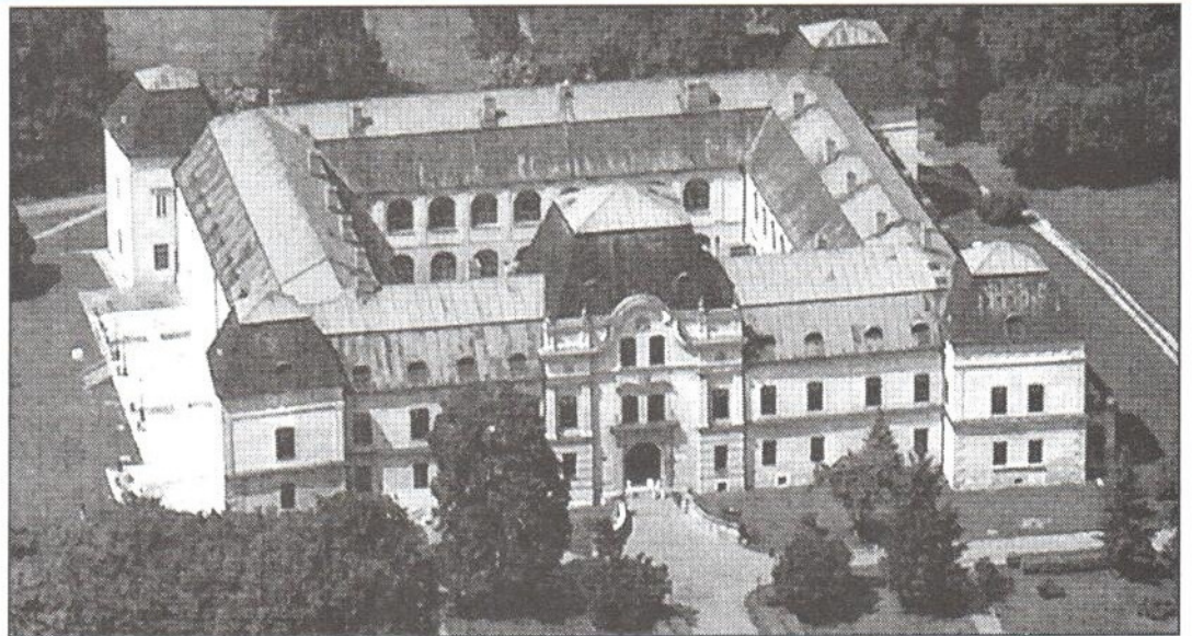
Renesančný kaštieľ v Humennom - sídlo Vihorlatského múzea.