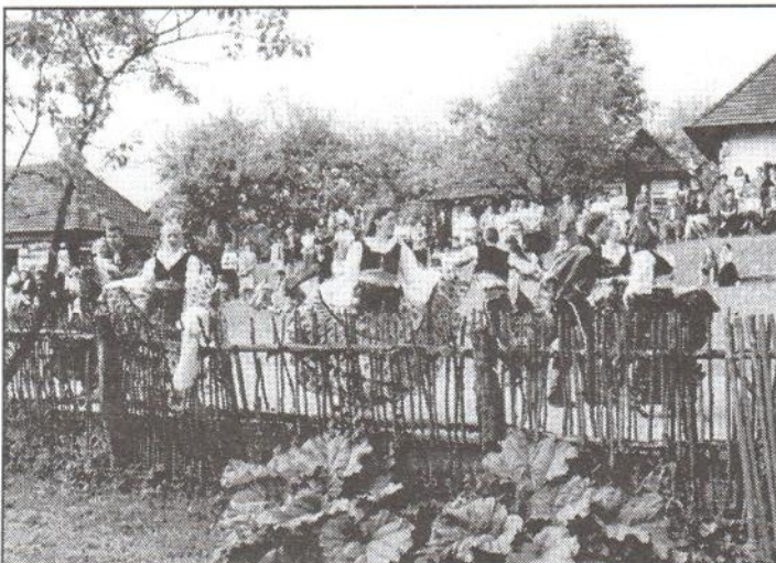
Areál skanzenu je tradičným dejiskom kultúrnych podujatí.

Nerozlučne spojená s obytnou architektúrou je aj sakrálna architektúra. V expozícii je zastúpená dreveným kostolíkom svätého Michala Archanjela z roku 1764. Kostolík pochádza z Novej Sedlice, pôvodne bol vystavaný bez jediného klinca. V jeho interiéri sa nachádza barokový etažový ikonostas z polovice 18. storočia. Kostolík má trojpriestorovú dispozíciu. Polygonálne presbytérium, štvorcovú loď a takzvaný „babinec“. Patrí medzi národné kultúrne pamiatky Slovenska.