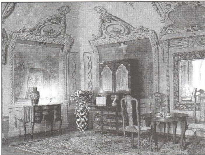
Orientálna izba v humenskom kaštieli.

je inštalovaná v pôvodných interiéroch kaštieľa a ponúka pohľad na bytovú kultúru šľachty od obdobia renesancie po 20. storočie. Prvá zmienka o kaštieli ako o kúrii je z roku 1449. V štyroch miestnostiach na prízemí kaštieľa sa zachovali iluzívne maľby, ktorých vznik sa datuje do obdobia vlády Márie Terézie. Na poschodí, ktoré je predelené tromi centrálnymi miestnosťami sa nachádzajú priestory dámskeho a pánskeho krídla. Centrálné miestnosti slúžili ako spoločenská sála, vestibul