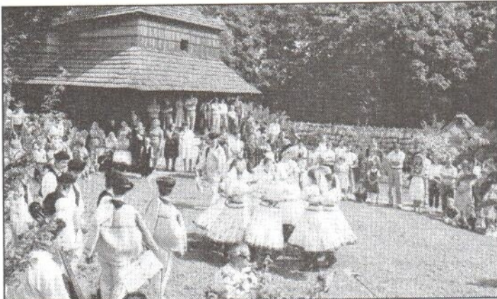
Medzinárodný deň múzeí (MDM) si svetová verejnosť pripomína 18. mája už od roku 1977. Prvé oslavy MDM v Humennom s kultúrnym programom v skanzene sa konali v roku 1986. Na snímke vystúpenie FS Vihorlat Snina (1986).