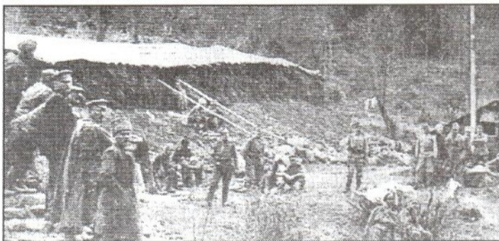
Zajatecký tábor v Oblazoch neďaleko Zboja v okrese Snina.

Vojna je hrozná realita. Hrozná svojou nezmyselnosťou a nepochopiteľnosťou v tom, že Homo sapiens sa napriek svojmu odvekému úsiliu o pokrok vzápätí navzájom vyvražďuje a stáva sa ničiteľom spoločne vytvorených hodnôt. Hrozná v tom, že ľudská spoločnosť sa dodnes z vojnových hrôz nepočula. Výstražnými mementami tejto nezmyselnosti sú vojenské cintoríny, kde vedľa seba ležia tí, ktorí sa navzájom nepoznali, možno priateľili a potom zabíjali.