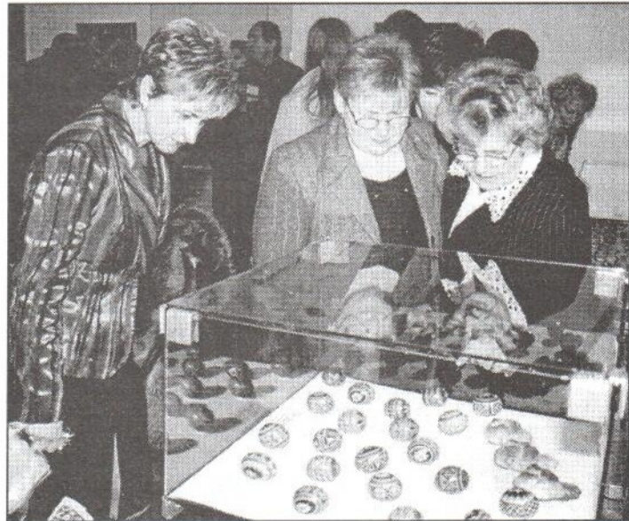
Mimoriadnemu záujmu sa počas tohtoročnej výstavy kraslíc tešili exponáty z Ukrajiny, ktorých technika zhotovovania dodnes uplatňuje pôvodné princípy farebnosti a vzorov.