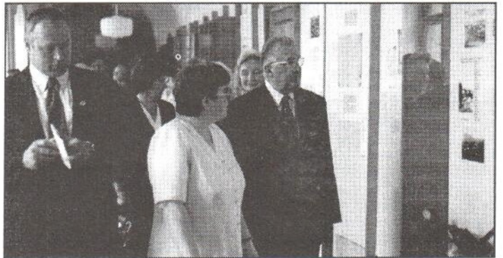
Prvý prezident SR Michal Kováč (vpravo) pri prehliadke výstavy.

Dlhodobá výstava Z histórie mesta Humenné ponúka prierez tým najzaujímavejším z bohatých dejín mesta a jeho okolia.