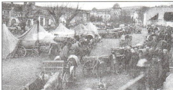
Hlavná ulica v Humennom po ruskej invázii v roku 1914.

Koncom novembra 1914 však v tyle frontu došlo pre obyvateľstvo k dramatickej zmene. Napriek tomu, že rakúsko-uhorské vojská držali v Karpatoch všetky dôležité priesmyky (Užocký, Lupkovský a Dukelský), podaril sa 48. ruskej divízii L. Kornilova preväpivý útok. Cez hrebeň Nastaz a údolím Cirochy smerovala ruská armáda na Humenné. Ťažké boje za použitia delostrelectva vtedy prebiehali v Stakčíne. Posledný pokus o zastavenie ruského útoku sa odohral 22. novembra 1914 v Kamenici nad Cirochou. Po niekoľkohodinovom krvavom boji však museli rakúsko-uhorské vojská nakoniec ustúpiť. Najväčšie obe si vyžiadal útok „na bodáky“ v priestore terajšieho