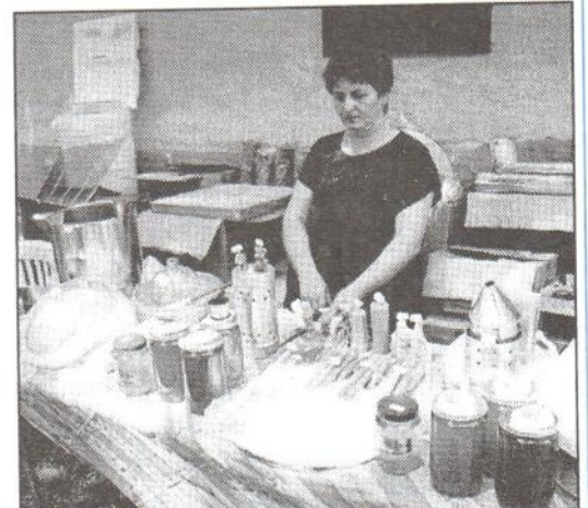
Med, medovina, medovníky a sviečky z pravého vosku - tradičná ponuka včelárov počas Medovej nedele v skanzene.