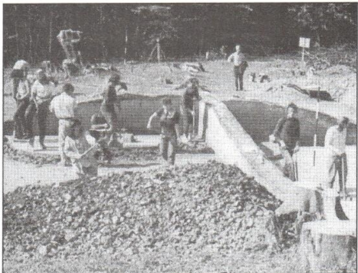
Archeologický výskum mohýl z neskorej doby kamennej, Brestov v okrese Humenné.