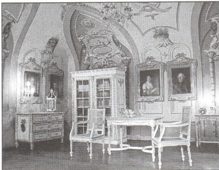
Ornamentálna izba v humenskom kaštieli.

V jednotlivých miestnostiach sa nachádza pôvodný mobiliár, historické zbrane zo zbierok Andrásyovcov, kovový trezor z obdobia 17. storočia, veľká baldachýnová posteľ, vzácna šperkovnica vykladaná mramorom. Zariadenie jednotlivých miestností podľa ich charakteru dopĺňajú historické hodinové stroje, porcelán, cínový a strieborný riad a iné dobové drobnosti.