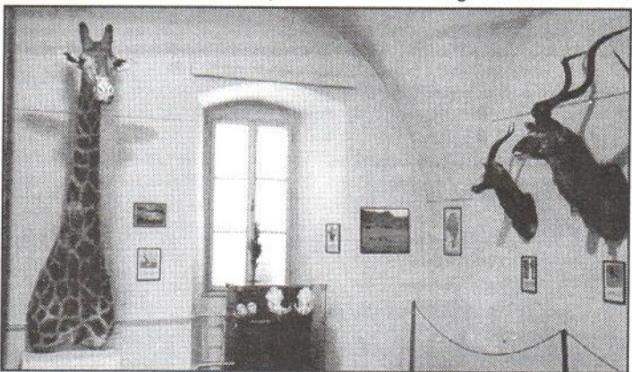
Časť exponátov výstavy exotickéj africkej zveri.