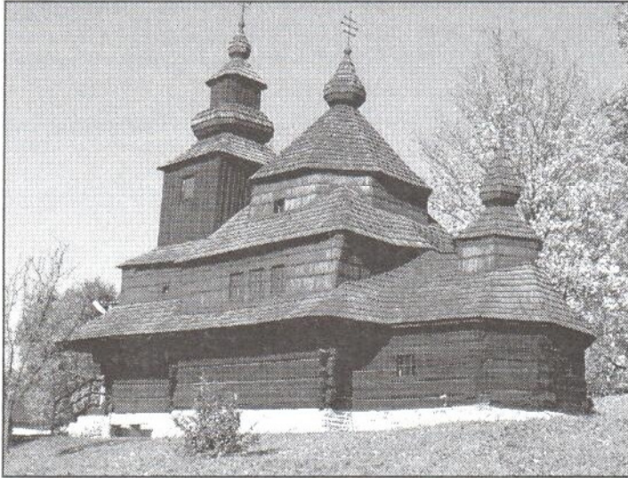
Drevený kostolík sv. Michala Archanjela v skanzene z roku 1764, pôvodne z Novej Sedlice.

bola vybudovaná v rokoch 1974 - 1982 a verejnosti sprístupnená v roku 1984. Na pomerne malej ploche sa v priebehu desiatich rokov podarilo sústrediť najtypickejšie stavby z regiónu severovýchodného Slovenska - štrnásť objektov ľudovej architektúry a jednu sakrálnu stavbu.