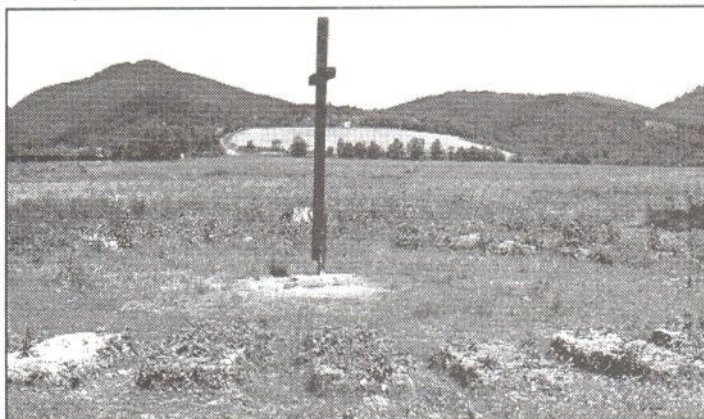
Vojenský cintorín z I. sv. vojny v Uliči. Na jeho obnove sa podieľa Obecny úrad v Uliči a Vihorlatské múzeum v Humennom.

Neskôr, na základe rozhodnutia velenia rakúsko-uhorskej armády sa po ústupe ruských vojsk z Karpát a západnej Haliče v máji 1915 začali zriaďovať spoločné vojenské cintoríny. V našom regióne padlých