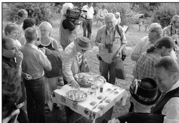
Výtvarného plenéra INSITA 2009 sa zúčastnili rezbári a maliari z Poľska, Maďarska, Francúzska a Slovenska.