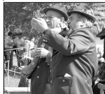
Dvojstranu pripravil V. Fedič a Z. Petrová

Deň svätého Huberta na Zemplíne patrí k tradičným podujatiam, ktoré Vihorlatské múzeum v Humennom pripravuje v spolupráci so Spolkom svätého Huberta na Zemplíne. Poslednými ročníkmi podujatia sa nám podarilo úspešne „prekročiť“ hranice regiónu i Slovenska a na podujatiach sme privítali hostí, ako aj účinkujúcich z Poľska, Maďarska a Českej republiky. Ako súčasť podujatia sa na nádvorí kaštieľa koná svätohubertska omša a odovzdávanie ocenení za rozvoj poľovníctva v regióne. Kultúrny program za účasti verejnosti prebieha v areáli skanzenu a je prezentáciou poľovníckych tradícií. K najpútavejším patria vystúpenia sokoliarov, chovateľov poľovníckych psov, ukážky poľovníckych signálov (foto dole) a rôzne súťaže s poľovníckou tematikou.