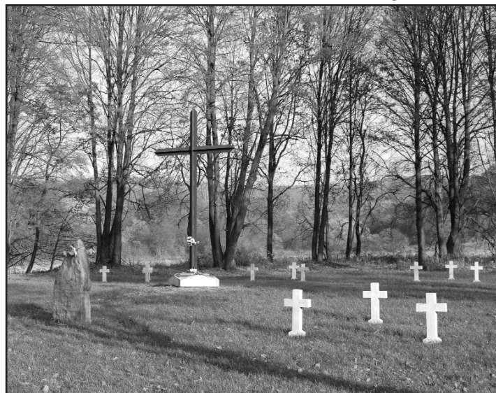
Zrekonštruovaný vojenský cintorín neďaleko kláštora v obci Krásny Brod