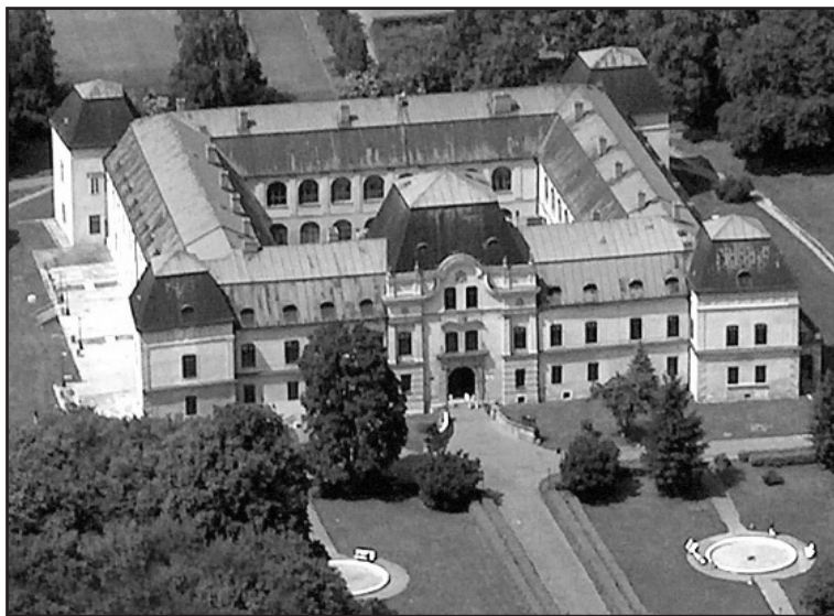
Pohľad na renesančný kaštieľ v Humennom (sídlo Vihorlatského múzea v Humennom).

Prvá fáza stavebných činností v múzeu predstavovala prípravu 4891 štvorcových metrov užitočnej plochy v pivničných priestoroch, na prvom a na druhom nadzemnom podlaží k stavebným zásahom. Demontované boli všetky expozície a dlhodobé výstavy. V zaujme ochrany a bezpečnosti zbierkových predmetov boli všetky múzejné zbierky opäť katalogizované, zabalené do ochranných fólií a sústredené vo vybraných priestoroch expozícií alebo v depozíte múzea v Kamenici nad Cirochou. Mobilár a ostatný majetok múzea bol uložený v pivničných priestoroch kaštieľa alebo v Kamenici nad Cirochou. Predmety, ktoré nebolo možné premiestniť boli obalené ochranným materiálom.