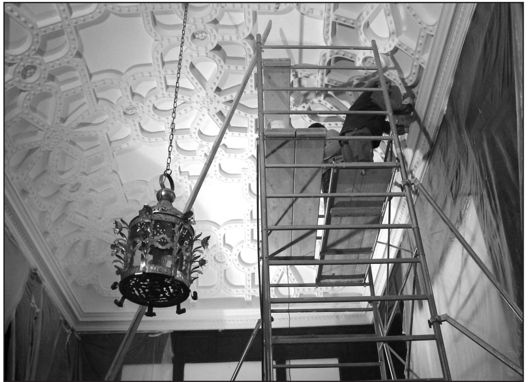
Reštaurovanie štukového stropu vo vstupnej hale kaštiela