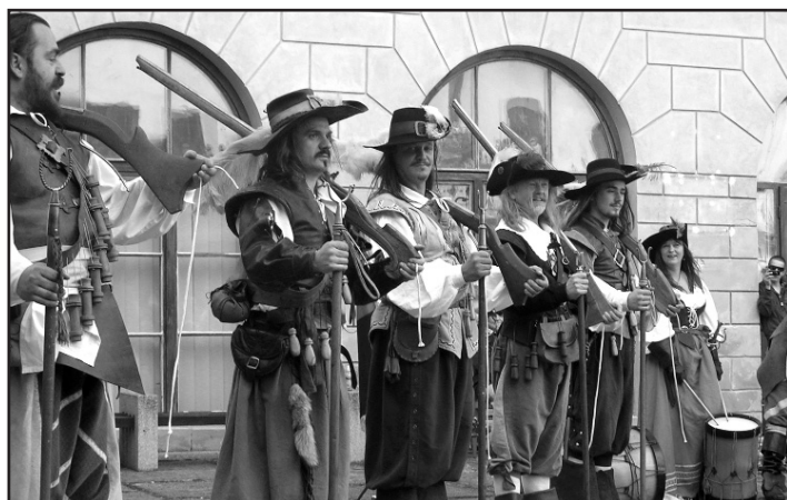
Historický šerm je každoročnou súčasťou osláv Medzinárodného dňa múzeí.