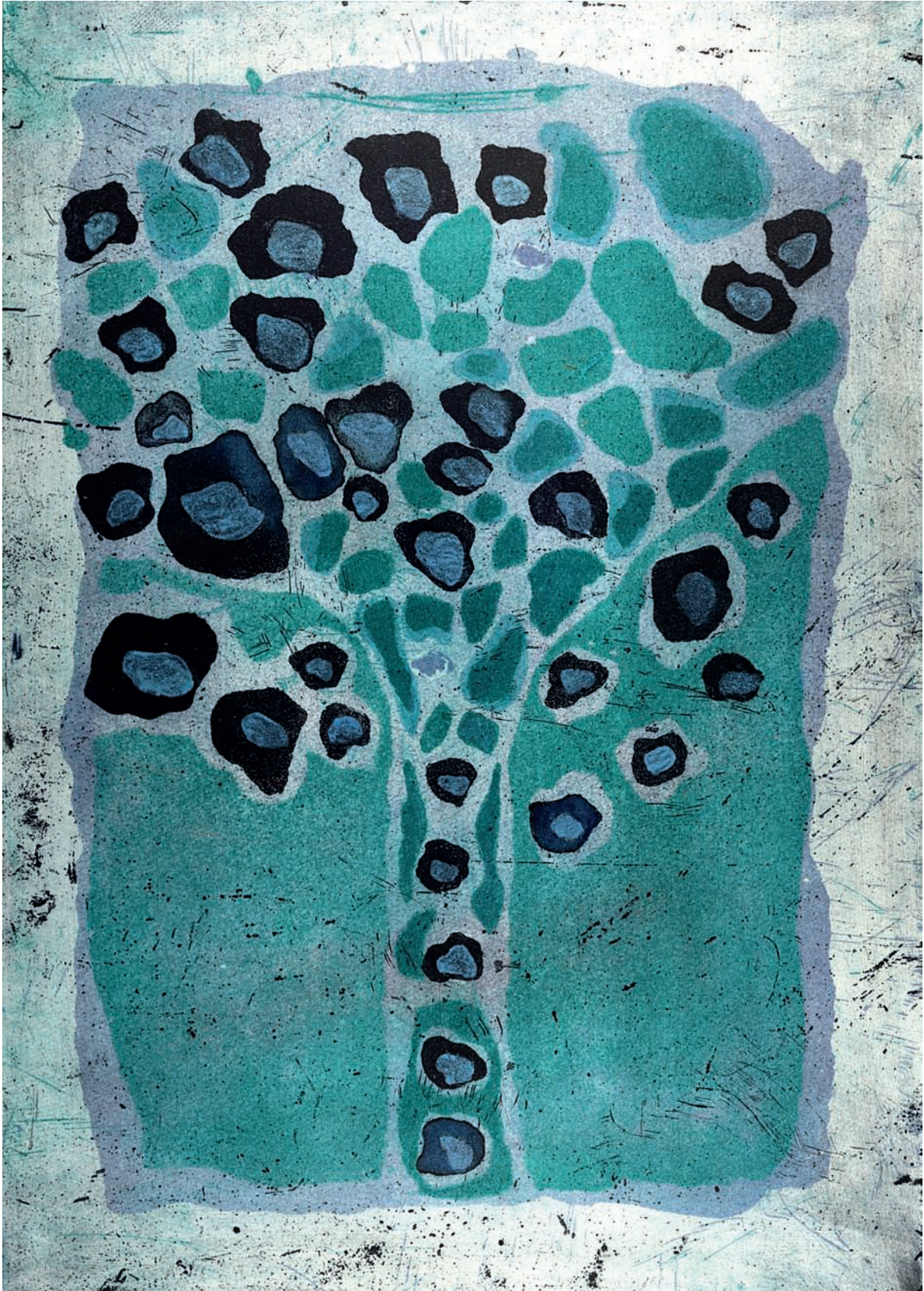
Stromohra II , 1989, lept, akvatinta