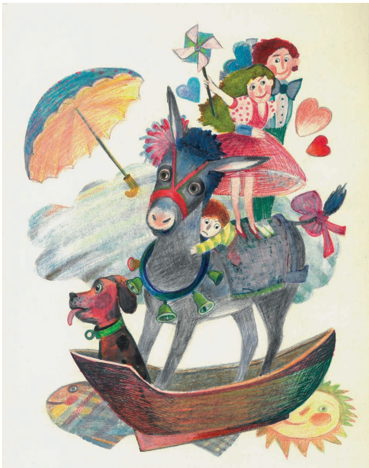
Bez názvu (ilustrácia), nedatované, kombinovaná technika