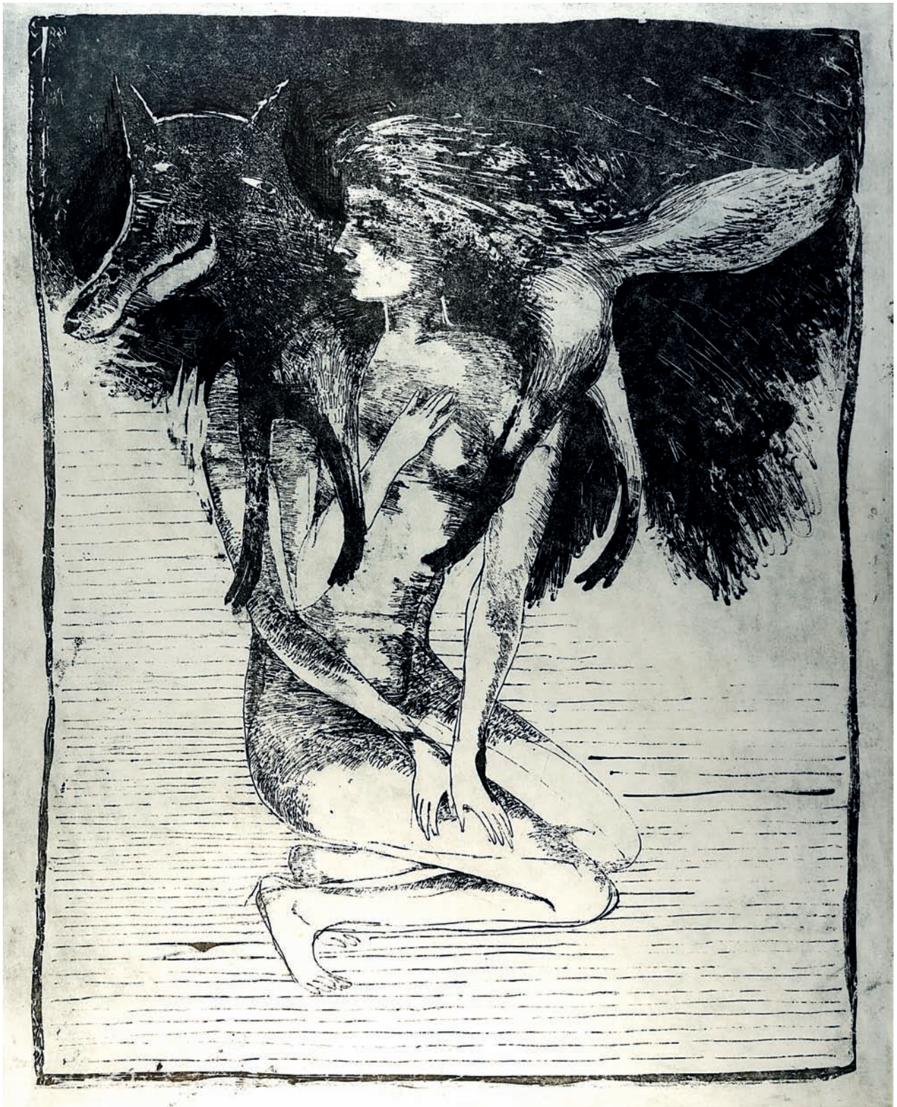
Balada o líšce , 1985, lept, akvatinta