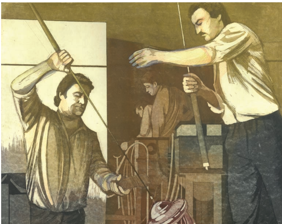
Sklári , 1985, lept, akvatinta