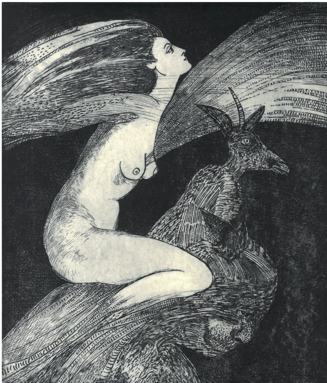
K básňam Miroslava Válka, 1982, lept