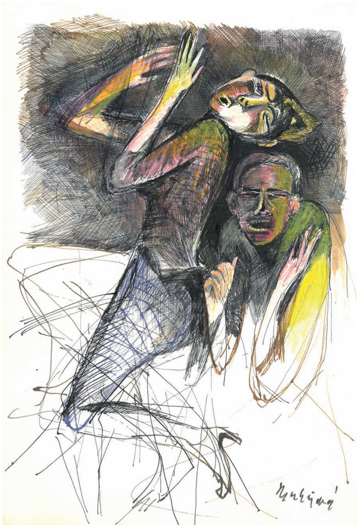
Bez názvu , nedatované, kombinovaná technika