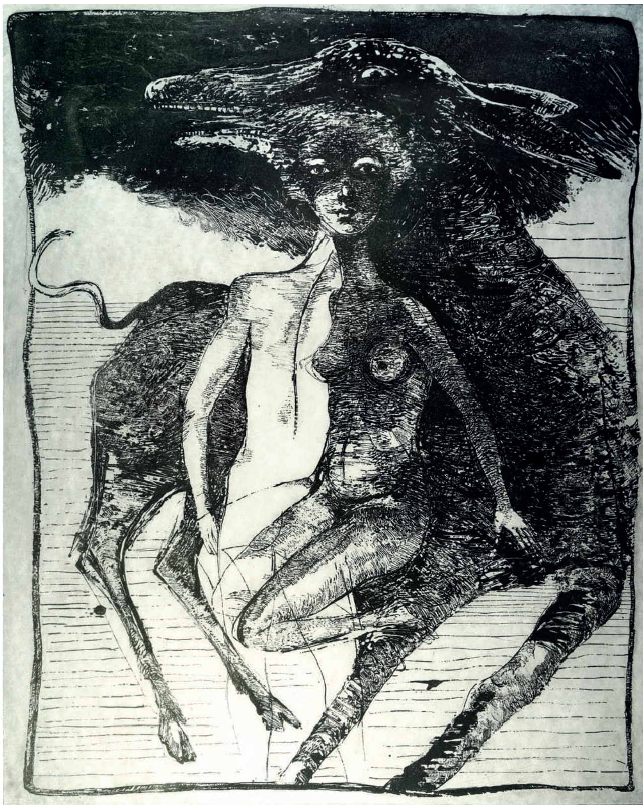
Balada o somárovi , 1985, lept, akvatinta