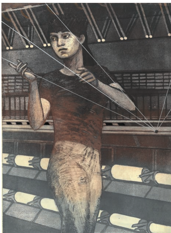
Zuzka , 1986, lept, akvatinta