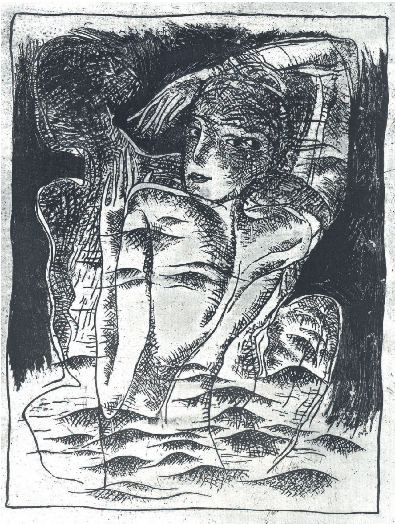
Miluj ma II , 1989, lept, akvatinta