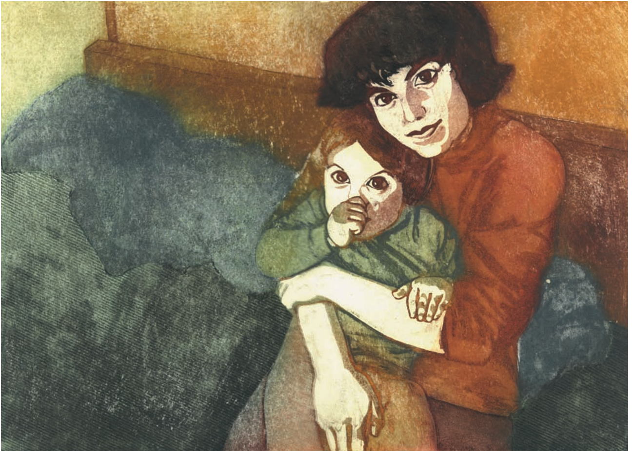
Moja rodina , nedatované, lept, akvatinta