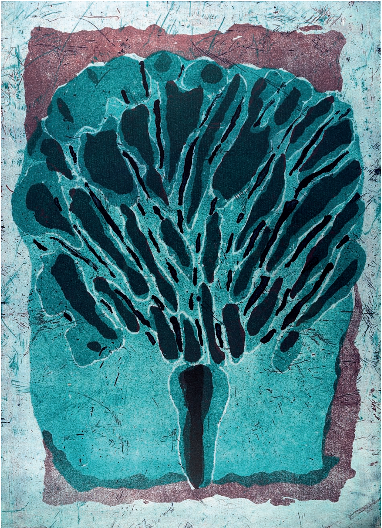
Stromohra , 1989, lepta, akvatinta